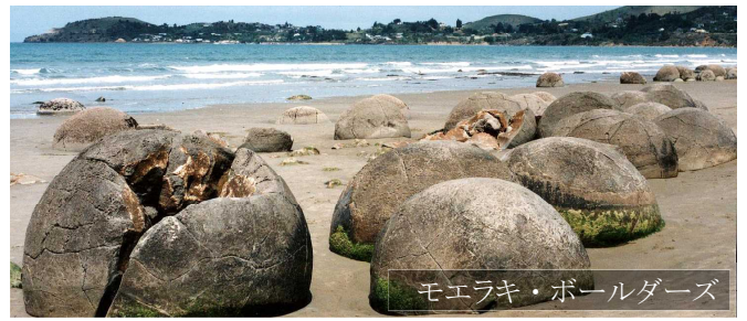
モエラキ・ボールダーズ

南島のクライストチャーチから南に車で約4時間の距離にある小さな漁村「モエラキ」のビーチにその奇岩があります。大きいものでは直径2.5mくらいの丸い石が波打ち際に打ち上げられたかのように50個以上が転がっています。※この奇岩はおよそ6500万年前に形成された亀甲状の凝結したものであり、真珠ができる過程に似て、核となる荷電した微粒子の周囲に水晶化したカルシウムと炭素物質が徐々に集積し400万～550万年もの歳月を経てこの丸石が形成されました。また、これら丸石を含む軟らかい泥石地層は約1500万年前に海底から隆起し、その後、風や雨、海の浸食作用によって泥石が洗い流され、浸食されない丸石だけが残ったものと考えられています。（※現地観光案内所の資料による）